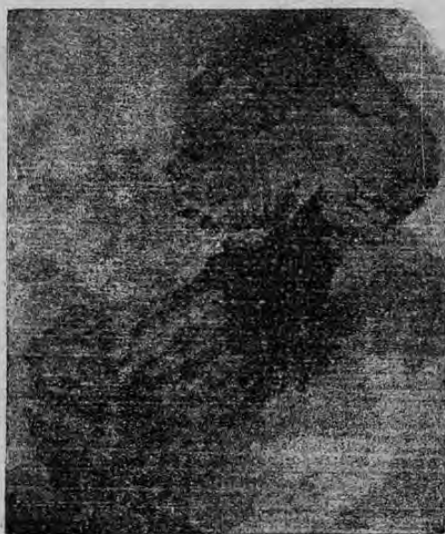
La erupción del mismo volcán en la mañana de ayer

Alajuela.—A las 7 y 15 a. m. de hoy se vio elevarse en dirección del volcán Poás una densa columna de humo coronada de un penacho blanco; luego se extendió en forma de nube, cubriendo el cielo hacia el Sur, y hora y media después caía en esta ciudad una ligerísima lluvia de ceniza húmeda casi imperceptible. No hay más datos de otros lugares.