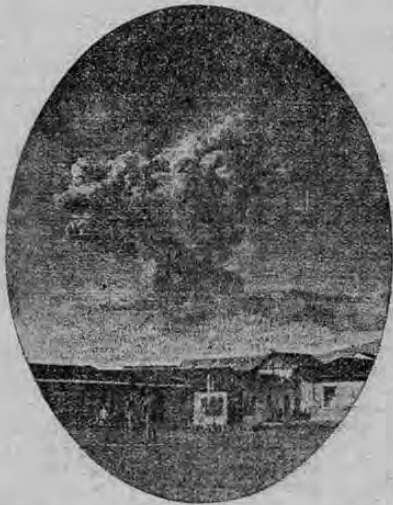
La erupción del Poás el 25 de Febrero de 1910

La erupción de esta mañana sólo tiene comparación con la habida hace cuatro años el 25 de enero de 1910, a las 2.20 minutos de la tarde, y que algunas personas achacan como el principio de una serie de cam-